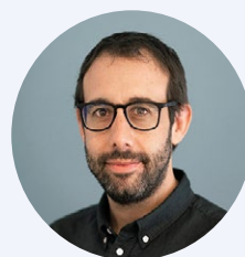
Leandro Folgar, presidente del Plan Ceibal:

Mateo señaló que la pandemia volvió a poner en valor las relaciones entre el alumnado y del alumnado con el profesorado. Insistió en que el reto en la pospandemia debe ser acelerar los aprendizajes, no solo para recuperar lo que no se ha aprendido, sino para solventar las deficiencias estructurales de los sistemas educativos. Para ello, deben cubrirse las necesidades básicas de los estudiantes (la alimentación, la salud mental, la infraestructura decente y la tecnología). Además, es necesario desarrollar el sector EdTech , que requiere de la alianza público-privada.