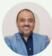
Marco Antonio Ávila Lavanal, ministro de Educación de Chile:

“Para innovar, es la tecnología la que debe estar al servicio de la pedagogía”.