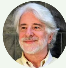
Leonardo Garnier, asesor especial de Naciones Unidas para la Cumbre sobre la Transformación de la Educación:

“La tecnología permite un estilo de aprendizaje mucho más activo y colaborativo, que promueva el aprendizaje basado en la interacción y la curiosidad”.