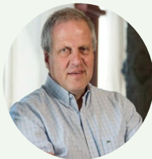
Jaime Perczyk, ministro de Educación de Argentina:

En su intervención el ministro invitó a que asumamos las brechas de aprendizaje derivadas de la pandemia. En relación a dichas brechas, el equipamiento y conectividad son los retos principales. También declaró que debe aprovecharse y reconocerse el valor de las competencias tecnológicas que los profesores desarrollaron, incluso de manera autodidacta, durante la pandemia. Por ello, es esencial poner en valor el rol de los docentes en relación con la innovación educativa.